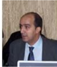
عبد القادر الأطرش - الجزائر -