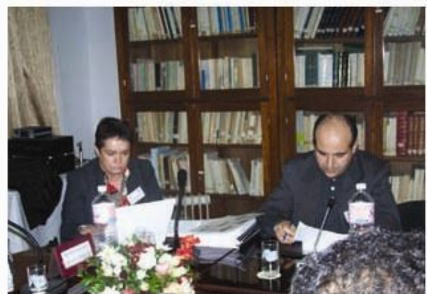
صورة للمشاركين خلال الجلسات