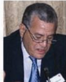
طيب كنوش - الجزائر -

فعلى المستوى الأول تحدث رئيس الجمعية العربية السيد مصطفى التير عن تجربته في مجال تطوير البحث في مجال الأخلاقيات والعلوم الإنسانية والاجتماعية من خلال عددا من اللقاءات التي نظمت بالتعاون مع المنظمة العربية للتربية والعلوم والثقافة ( الألكسو).